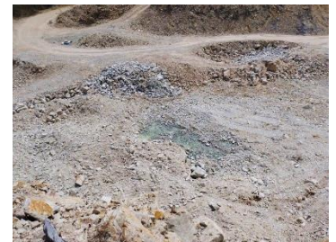
บ่อรองรับน้ำ