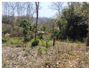
แนวเวนไม่ทำเหมือง