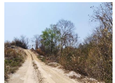
เส้นทางขนส่งแร่