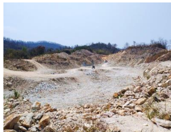
พื้นที่หน้าเมืองปัจจุบัน

พื้นที่โครงการ ประทานบัตรที่ 30451/15783